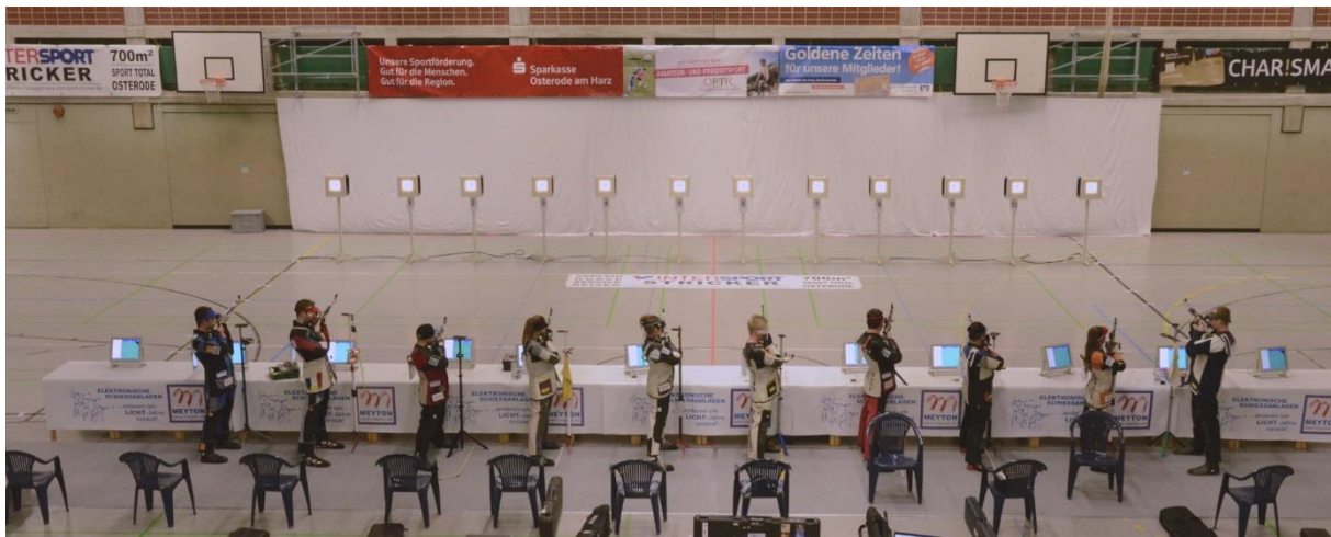
Das Match zum Auftakt: SB Freiheit gegen die SG Hamm.