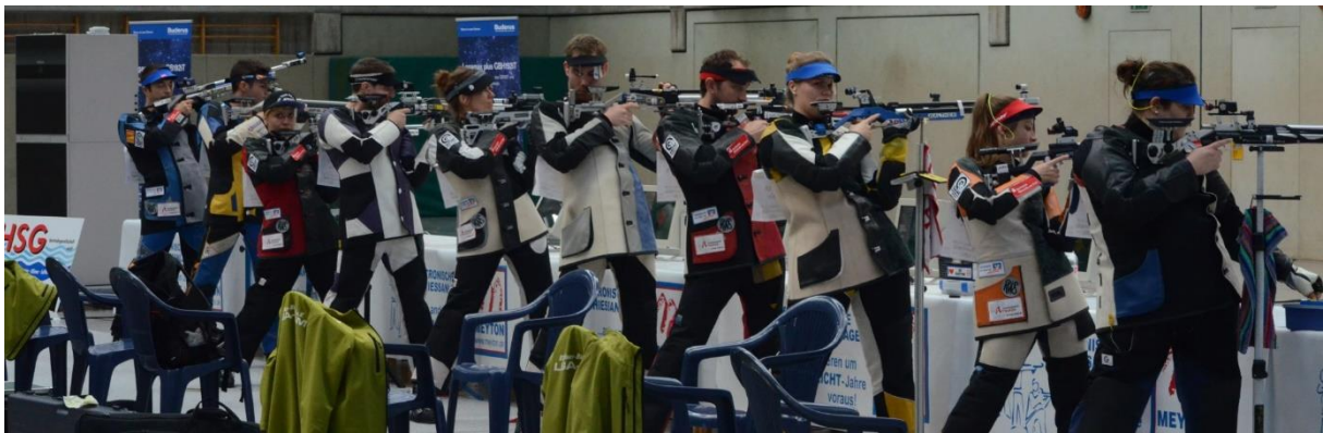
Das Kräftermessen mit einem ehemaligen dreifachen Deutschen Meister: SB Freiheit gegen den BSV Buer-Bülse.